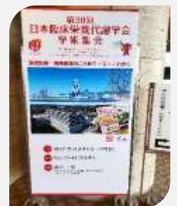
▲第36回 JSPEN（現地会場にて撮影）

COVID-19 の影響で一般演題の発表は事前録音によるオンデマンド配信のみとなってしまったことがとても残念ですが、データを集計し資料を作り上げたことで多大な経験を得られたと感じています。今後聴講者が当発表を役立ててくれることを願っています。また、現地およびオンデマンド配信で多数の演題を聴講しました。COVID-19、新規経腸栄養製品コネクタ、簡易懸濁法など様々な分野の新たな知識を得ることができました。近いうちに必要部署へ必要な情報を提供し、今後当院でより良い医療を提供するため尽力していく所存です。