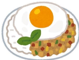
タイ ガパオライス